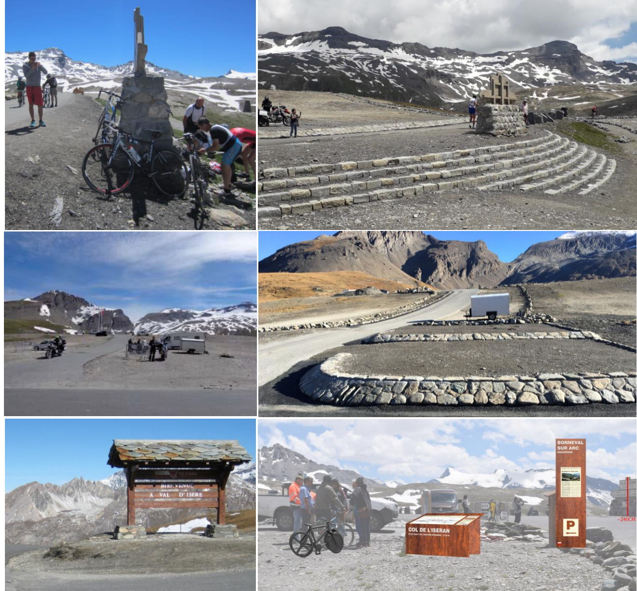
Avant / Après