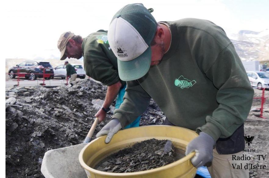
Tamisage, Tri manuel des pierres, Etrépage, Mise en défens